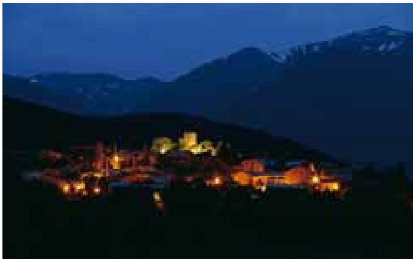
Éller, i al fons, el Puigpedrós

l'església i la font. Si es vol, des d'aquí es pot pujar fins a Tallendre seguint el camí marcat.