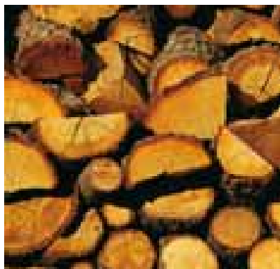
Fusta tallada i camps de cereal d'Éller