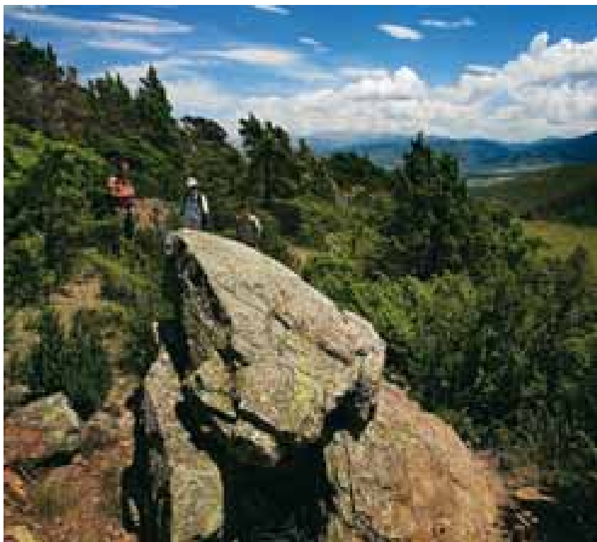
Dolmen del Coll de Fans

Al creuar el torrent, a l'esquerra es veu el sòcol d'una antiga palanca. Es continua pel camí que ara puja en direcció a Ordèn i es passa per aplevats molsuts que pastura el bestiar, des d'on es veuen uns camps als quals la tosa d'Alp els fa de decorat. El camí arriba a Ordèn [5] pel costat d'un excel·lent mur de pedra seca signat i datat a la cantonada. Cal baixar, a l'esquerra, fins al collet on es