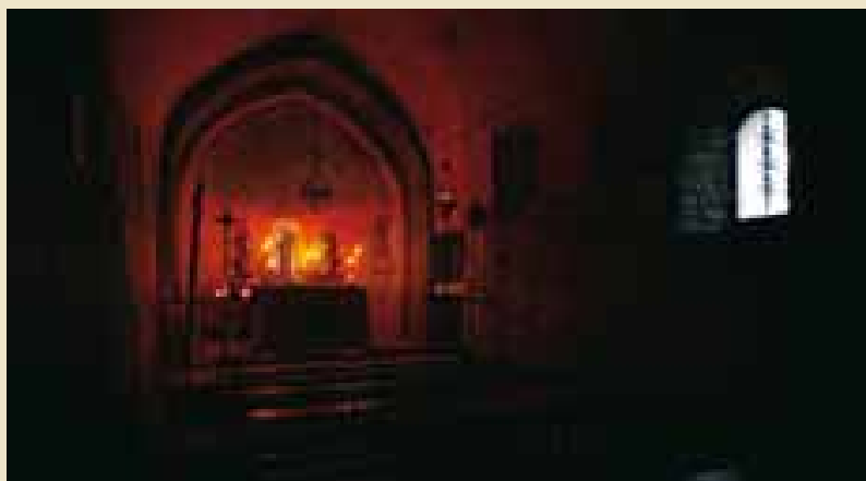
Església de Sant Iscle i Santa Victòria de Tallendre, segle XII

L'anticlericalisme senyorial responia a tot un seguit de conflictes de tipus feudal, en els quals es qüestionava el poder polític i econòmic que havia anat acumulant l'Església en el segle anterior. Aquest anticlericalisme pragmàtic, la realitat de nombroses reconciliacions amb l'Església per part d'alguns d'aquests senyors per tornar a recaure tot seguit en l'heretgia i el testimoni de les riques deixes testamentàries de l'Església catòlica, fan qüestionar el grau de sinceritat amb què aquests senyors abraçaven la nova fe, i si no veuriem en ella més aviat la manifestació del seu posicionament contra l'Església o, si més no, si no voldrien garantir la seva salvació saltant contínuament d'un costat a l'altre la línia divisòria que separava les dues religions