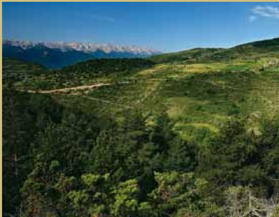
Vista de Tallendre i del Cadí des del camí d'Éller a Ordèn